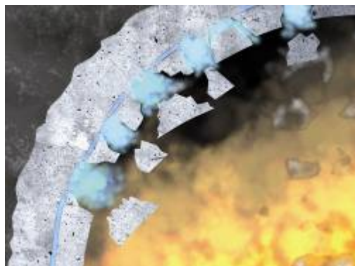
Bild 6: Der Dampfdruck in der Sättigungszone übersteigt die innere Festigkeit des Betons. Es kommt zu Abplatzungen.