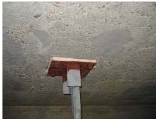
Bild 8: Der Brandschutzmörtel wurde auch als Ankerplattenschutz eingesetzt.