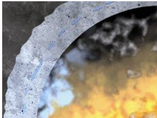
Bild 4: Der Dampf füllt die Poren und entweicht über die beflamnte Seite. (Bild: Sika)

steigender Temperatur wird der Dampfdruck in der Sättigungszone immer größer. Es kommt zu Betonabplatzungen, sobald der Druck des Wasserdampfes größer wird als die innere Festigkeit des Betons (Bild 6). Hinter dem nun freigelegten Beton entsteht wieder eine neue Sättigungszone. Der Beton wird so während eines Brandes ständig weiter angegriffen und vollkommen zerstört. Bei Temperaturen über +1000^{\circ}\text{C} kann sich ein Feuer mit einer Geschwindigkeit bis zu 20 cm/h durch den Beton fressen. Dieser Wert nimmt bei hochfesten Betons zu, da die dichte Matrix die nicht chemisch gebundenen Wasser nur schwer entweichen lässt. So steigt der Dampfdruck sehr schnell über den kritischen Wert der Zugfestigkeit dieses Betons.