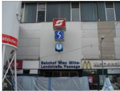
Bild 1: Trotz Umbau ist der Bahnhof Wien Mitte in Betrieb