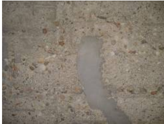
Bild 7: Korrodierter Stahl wurde mit Korrosionsschutz behandelt und mit Reprofilierungsmörtel ausgeglichen.