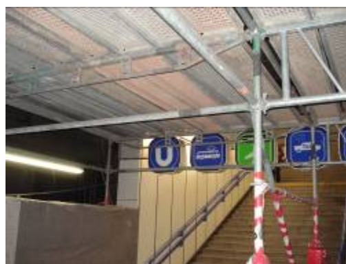
Bild 2: Treppe zur U4 mit Arbeitsbühne und tiefer gehängten Infrastrukturelementen

Nach der Betonsanierung sollte die Deckenuntersicht im Stationsbereich mit einem geeigneten Brandschutz versehen werden. Laut Ausschreibung konnte dies in drei verschiedenen Varianten erfolgen. Die erste Möglichkeit sah vor im Zuge der Betonsanierung eine entsprechende zusätzliche Betonüberdeckung zu schaffen um einen Brandschutz herzustellen. Zweitens wurde das Aufbringen einer Brandschutzbeschichtung mittels Spritzverfahren ins Auge gefasst, welche den Anforderungen des ÖVBB Merkblattes „Schutzschichten für den erhöhten Brandschutz für unterirdische Verkehrsbauwerke“ entspricht. Die Ausschreibung setzte voraus, dass sich im Untergrund bildende Risse an der Mörteloberfläche abzeichnen müssen. Die dritte Variante war die Herstellung des Brandschutzes durch Brandschutzplatten, die Revisionsöffnungen an statisch relevanten Stellen aufweisen musste [1].