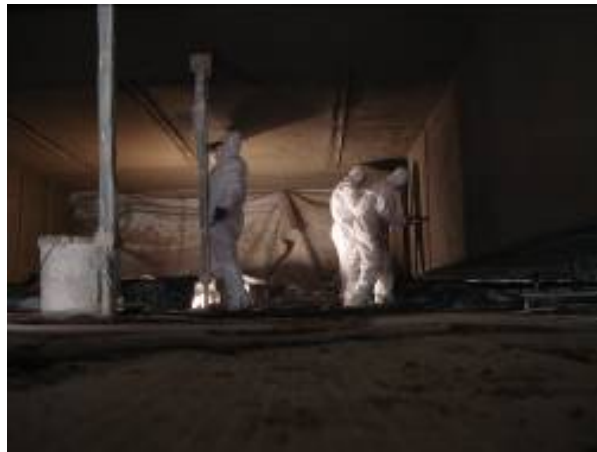
Bild 9: Brandschutzapplikation auf einer Arbeitsbühne.

Das schichtweise Aufspritzen des Mörtels bringt drei Vorteile mit sich: erstens der aufgetragene Mörtel steift schneller an, was zur Folge hat, dass sich beim Abziehen auf den Holzlatten nicht die ganze Mörtelschicht bewegt. Wird ein zu feuchter Mörtel zu stark beansprucht, reißt er an der Oberfläche auf, bildet Blasen oder der Haftverbund zum Untergrund wird durch die Abziehbewegungen an der Oberfläche stark gemindert. Zusätzlich kann mit einem schichtartigen Auftrag passgenauer gespritzt werden, das heißt es benötigt einen geringeren Aufwand die Oberfläche des Brandschutzmörtels zu egalisieren als beim Aufspritzen zwischen den Profilen unter einem Arbeitsschritt. Zudem ist der Rückprall verschwindend klein. Dank dieser effizienten Applikationsart und den hervorragenden Verarbeitungseigenschaften des Brandschutzmörtels konnten Tagesleistungen von 150 -250 m 2 erbracht werden.