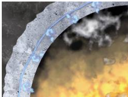
Bild 5: Die Poren im Beton sind voll. Es bildet sich eine Sättigungszone.