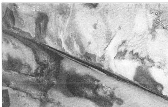
Bild 1: Typischer Frostschaden einer dünnen Spritzbetonschicht eines 30 Jahre alten Tunnels

Frost/Tau-Laborversuche haben gezeigt, daß Spritzbeton mit erhöhter Wasserglas Dosierung erhöhte Delaminationen aufweist (Diplomarbeit, Løken und Mørch 1994).